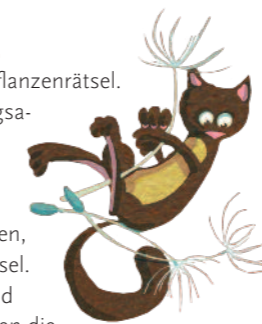
Illu: © Cornelia Haas

Komm mit mir in den Garten! singt er und lässt Zeit zum Mitraten. Im Booklet stehen die Liedtexte und Hinweise, wie die Musik das Typische von Tieren und Pflanzen spiegelt.